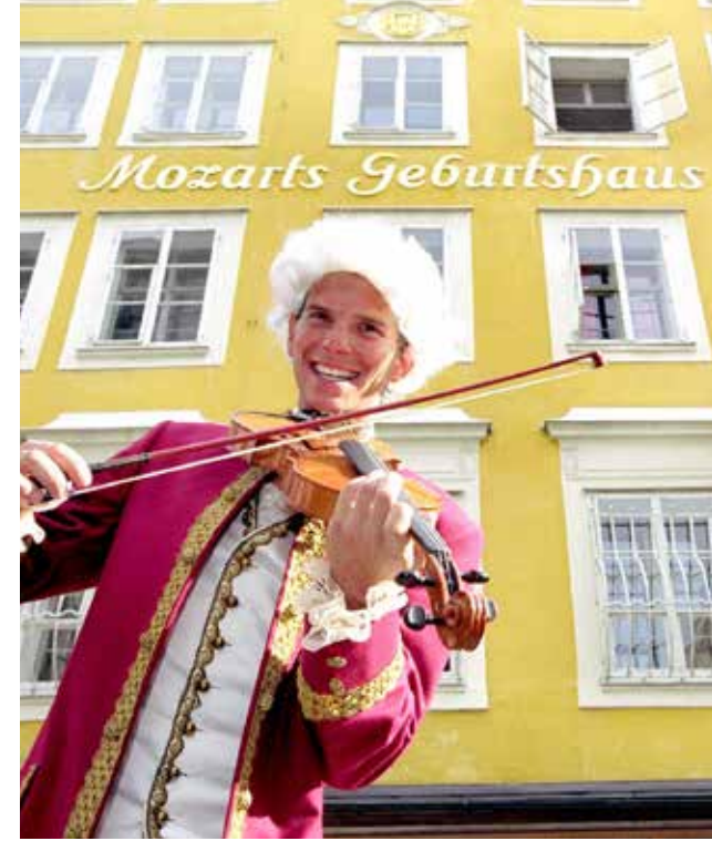
Grafik und Design: www.agentur-zeichensprache.at